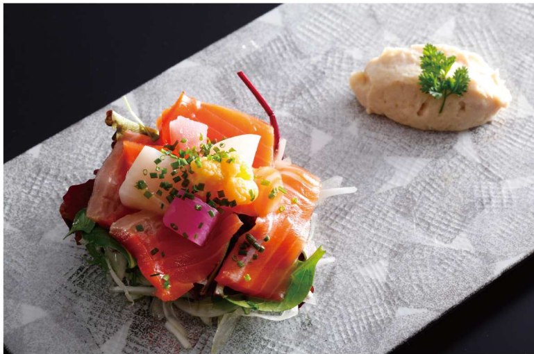
淡路島サクラマス

苺 【旬の時期】1月～5月頃 甘酸っぱくて、とてもジューシー。島内にはたくさんの産地があり、さものか・紅つべなどいろいろな種類の産品が楽しめる。