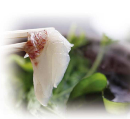
桜鯛と新わかめのしゃぶしゃぶ